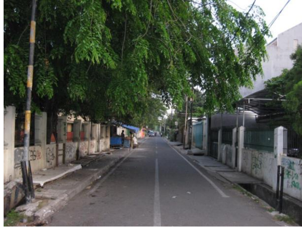
Tjilamajaweg genomen vanaf de Ciujung.

Woensdagmiddag 19 oktober 2011 zijn we opnieuw naar de wijk gegaan en nu op zoek naar de Tjilamajaweg nummer 10. Na een beetje gezocht vonden we het adres en laat het oorspronkelijke huisje er nu nog steeds staan!!